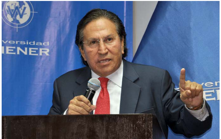
El expresidente Alejandro Toledo se pronunció por la necesidad de una educación de calidad para el desarrollo del país.

En su conferencia, realizada el 31 de agosto en el Aula Tribunal, Toledo abordó también los temas de inseguridad ciudadana, la inversión extranjera y la necesidad