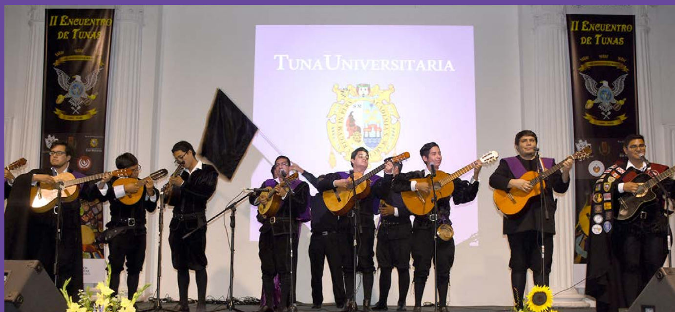
La Tuna Universitaria de la UNMSM estuvo presente en el encuentro convocado con ocasión del primer aniversario de la Tuna de la Universidad Wiener.