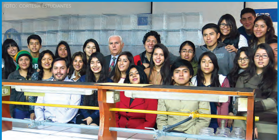
El rector de la Universidad Wiener, médico de profesión, siguió con entusiasmo el trabajo de los estudiantes que implementaron el bioterio.

Cuando empezó el proyecto culminaba el semestre académico; así, el docente planteó un reto que los estudiantes asumieron resueltos: en el tiempo de vacaciones, ellos fabricarían las jaulas de acuerdo con los estándares internacionales. Y fue así como durante un mes, trabajando a veces doce horas diarias,