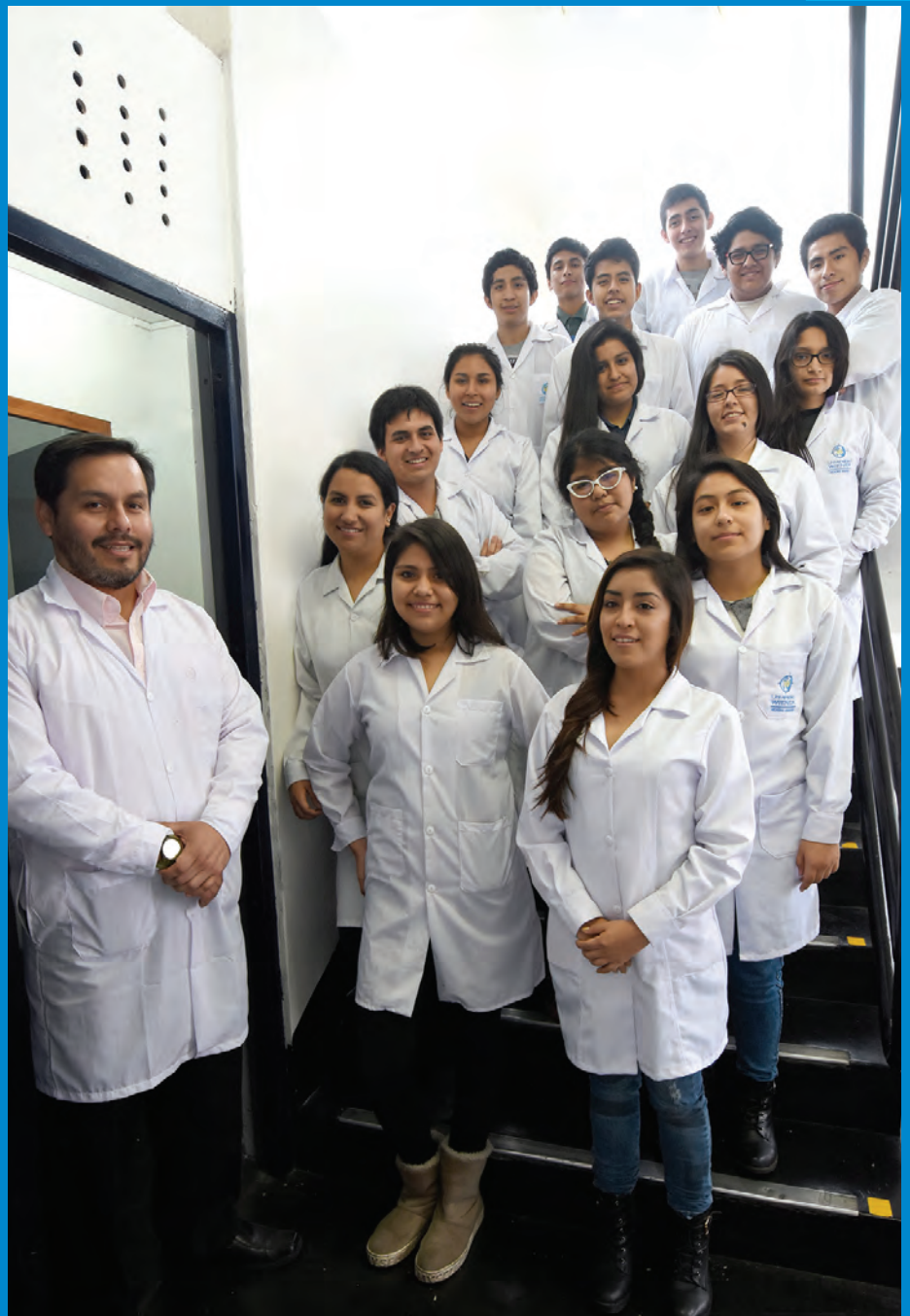
El equipo y el bioterio terminado.

El camino es largo; pero hay disciplina, entusiasmo e inteligencia.