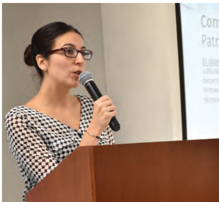
Vera Pons (UNESCO)

estudio, que solo estaban diseñados para la investigación. "Se requiere entonces considerar la formación en gestión, en legislación, de manera que los estudiantes de pregrado comprendan los alcances y limitaciones; que sepan cómo se gestionan esos bienes, que todo no termina con la excavación, sino que allí empieza una puesta en valor del patrimonio encontrado; que profundicen además en aspectos éticos y deontológicos; y que consideren el espacio urbano y lo que se desarrolla frente al monumento" señaló.