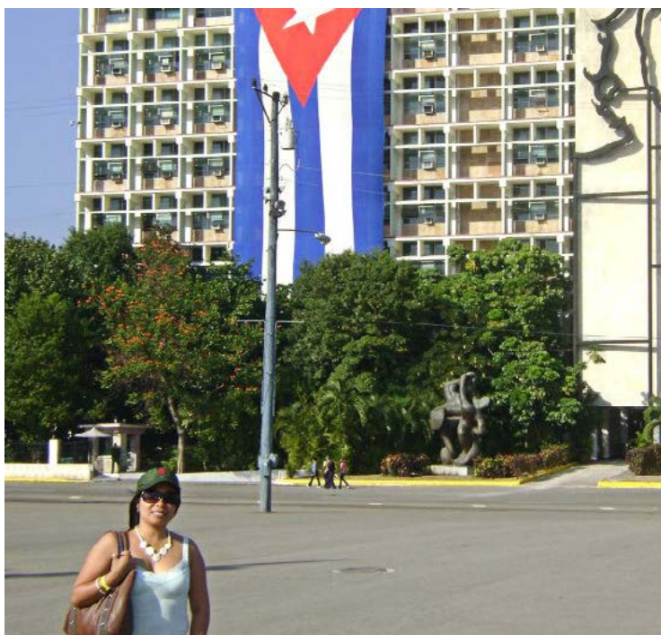
En Cuba, a donde fue enviada para recibir capacitación.

El propósito, en resumen, es identificar el potencial de un nuevo medicamento en una población a nivel mundial, que lleva a descubrimientos innovadores para el tratamiento de diferentes enfermedades. La responsabilidad con que ha asumido su profesión la llevó a estudiar una maestría en Ética y Bioética Clínica, y capacitarse en Alta Gerencia y Administración en los Servicios de Salud, Enfermería Gerencial, Gestión de la Calidad en el Cuidado en Enfermería. Actualmente estudia Auditoría Médica y Control de Gestión de los Servicios de Salud. Su propósito es estar preparada para la dirección, gestión y administración.