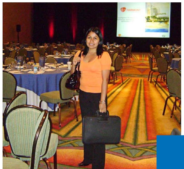
En Atlanta, durante uno de los Investigator Meetings.

“En un principio –recuerda nuestra egresada– quería estudiar Medicina, pero las circunstancias me lo impidieron, así que me