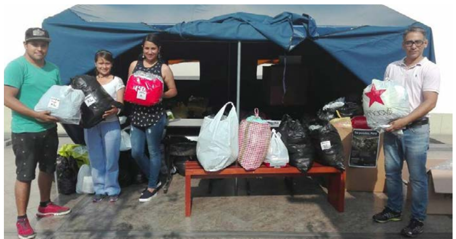
Estudiantes y personal administrativo formaron parte del grupo de voluntarios que recibieron y clasificaron la ayuda material que fue acopiada en la sede de la Universidad.

Esto en cuanto a la primera intervención, pues en una segunda etapa, prevista para fines de abril, se ejecutará la instalación de un centro de asistencia para el