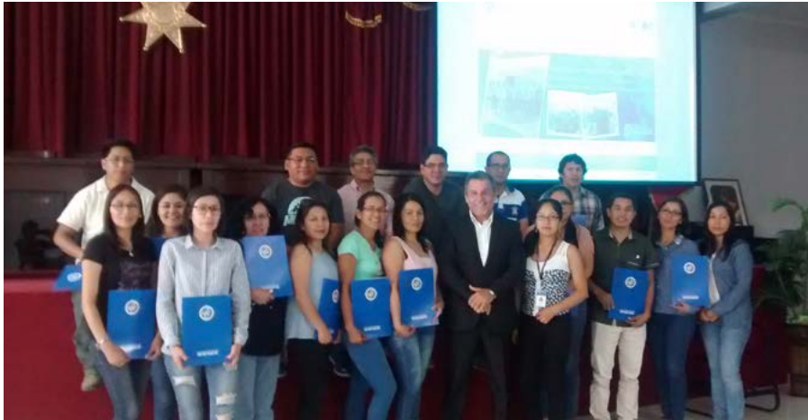
Los profesionales huanuqueños recibirán especialización en la ciudad donde residen.

Una buena aceptación tuvo el Programa de Segunda Especialidad en Gestión del Despacho Fiscal que dicta la Facultad de Derecho y Ciencia Política de la Universidad Wiener en el Colegio de Abogados de Huánuco, con la finalidad de brindar capacitación a los profesionales que tengan interés en ingresar o permanecer en la carrera fiscal.