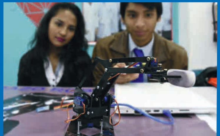
En la feria se presentó también un brazo robótico.