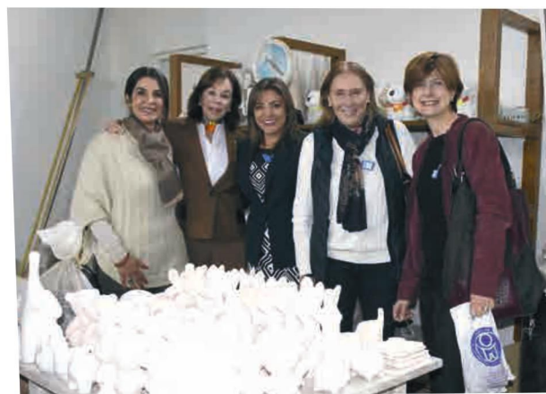
Benefactoras de la institución en el taller de cerámica.