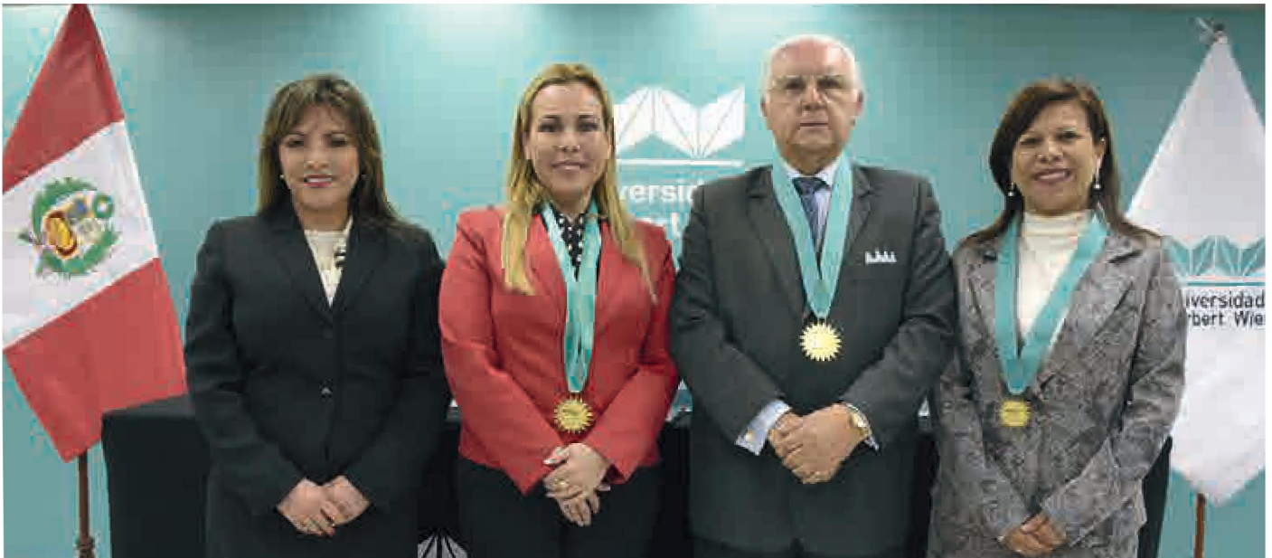
La titular del MIDIS inauguró el conversatorio promovido por la EAP de Nutrición Humana, que coincidió con la campaña Hambre Cero que impulsa su sector.